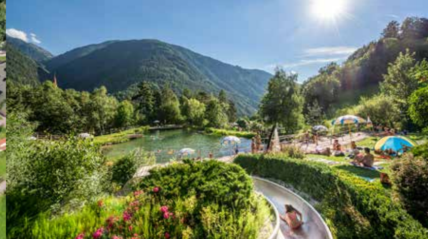
Naturbadeteich (Preisermäßigung für Gäste), Tennisplatz (Reservierung Tel. +39 0472 413 785),