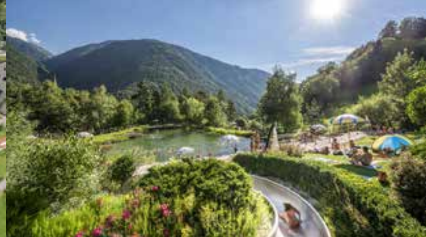
Naturbadeteich (Preisermäßigung für Gäste), Tennisplatz (Reservierung Tel. +39 0472 413 785),